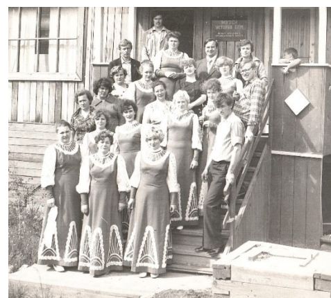
Народный хор «Русская песня» в п. Звездный. Концерт для строителей БАМа. 1981-82г

Строители выполнили решение XXVI съезда КПСС и обеспечили проезд на всём протяжении Байкало-Амурской железнодорожной магистрали: «Москва–Тында», «Москва–Нерюнгри», «Северобайкальск – Анапа» и другие направления.