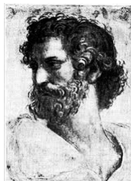
Аристотель (348—322 до н. э.)

юношей и остался там на 20 лет. А со своими учениками Аристотель проводил занятия во время общей прогулки. Учитель и ученики его школы получили название «перипатетики», или «прохаживающиеся».