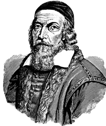
Ян Амос Коменский

«Сама школа должна быть приятным местом, доставляя глазам привлекательное зрелище изнутри и снаружи. Внутри она должна быть светлой, чистой, украшенной картинами, портретами знаменитых людей, географическими картами, памятниками исторических событий, эмблемами. А извне к школе должна примыкать не только площадка для прогулок и игр, но также небольшой сад...»