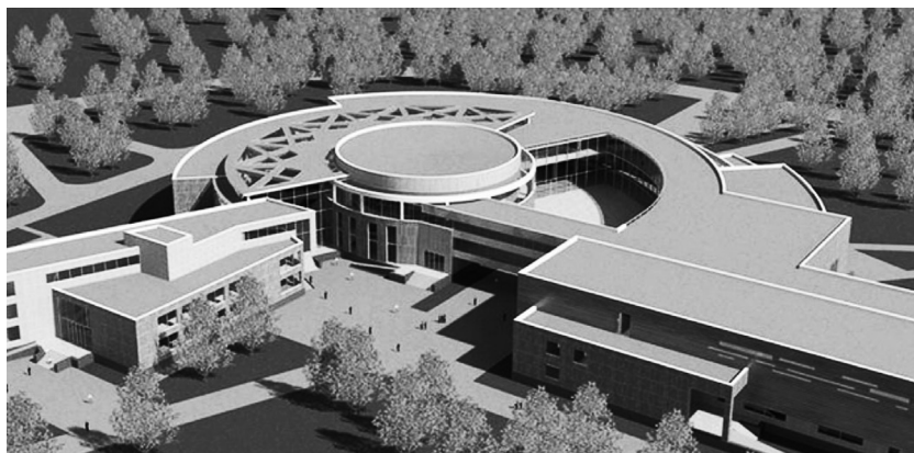
Проект нового школьного здания

Особенностью новых школ являются библиотеки, тренажёрные залы, бассейны, учебные кабинеты и лаборатории, открытый доступ в Интернет, электронные учебные пособия, персональные компьютеры и другое оборудование.